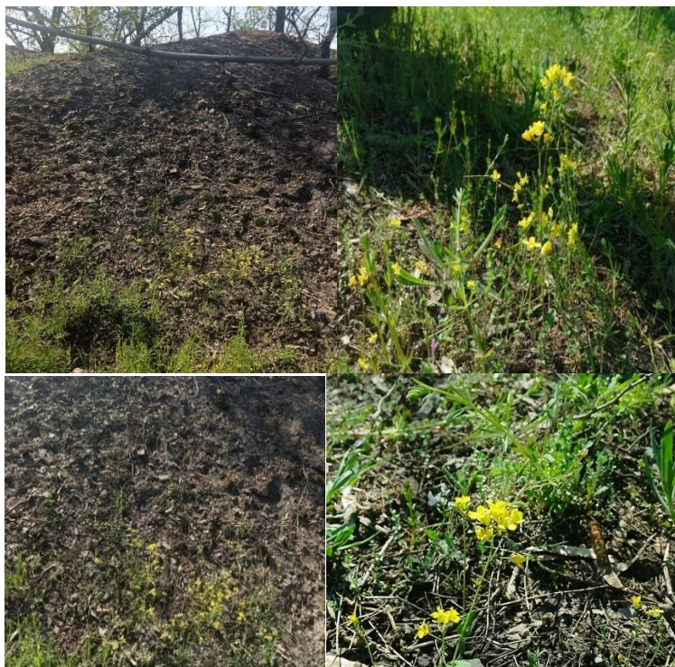
Рис. 1 Результаты посадки рапса озимого на плато и склонах породного отвала

В 2024 и 2025 гг. были произведены двукратные отборы проб породного субстрата (по Методическим указаниям по определению тяжелых металлов в почвах сельхозугодий и продукции растениеводства Министерства сельского хозяйства РФ) на модельном озелененном породном отвале ДНР ш. 5/6 имени Димитрова, находящемся в черте г. Донецка, ДНР.