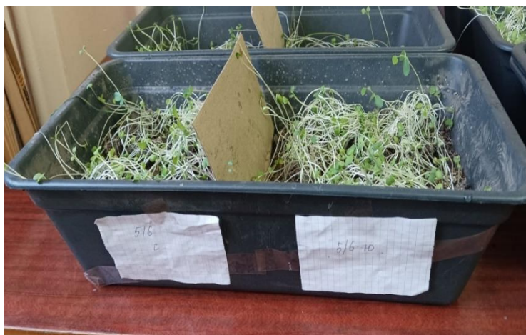
Рис. 2 Проростки рапса озимого в породе отвала в лабораторных условиях

Посадка семян Brassica napus L. на породном отвале шахты 5/6 имени Димитрова (г. Донецк, ДНР) произведена в октябре 2024 г. на плато отвала, северном и южном склонах. Первые всходы появились через 6 дней на плато отвала. Появление всходов рапса на склонах наблюдалось через 3 недели (рис. 1).