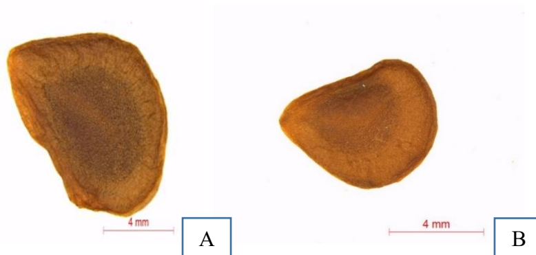
Рис. 2 Семена Lilium pilosiusculum (Freyn) Misch. (A) и Lilium pumilum Delile (B)

Семена L. pilosiusculum неправильной округло-треугольной формы с округлыми краями и пленчатым крылом, в среднем 7,4 мм длиной и 5,4 мм шириной, с эндоспермом, буровато-коричневые (табл. 1, рис. 2А). Семена L. pumilum – в среднем 5,1 мм длиной и 4,1 мм шириной. Исследованные биометрические параметры семян характеризуются низким уровнем изменчивости (4,4-7,0%).