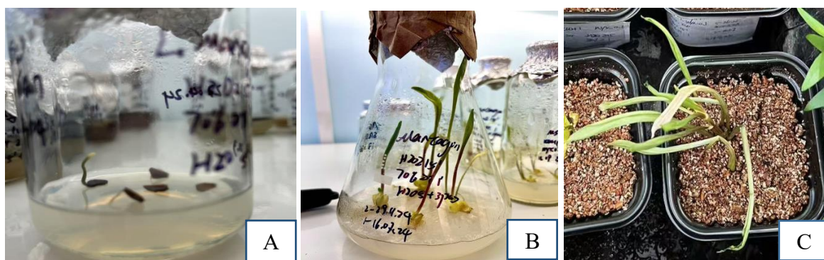
Рис. 3 Этапы размножения in vitro Lilium pilosiusculum (Freyn) Miscz.: А – посев семян на питательную среду; В – развитие эксплантов на питательной среде MS; С – посадка растений в питательные субстраты для последующего доращивания

Максимальная длина листьев ( 6,2 \pm 0,6 мм) и корней ( 3,0 \pm 0,4 мм) отмечены при использовании 6-БАП в концентрации 0,4 мг/л. Г.В. Филлипова и др. [11], изучавшие размножение in vitro L. pensylvanicum , также определили, что для развития растений эффективно использование среды, содержащей 6-БАП в концентрации 0,4 мг/л.