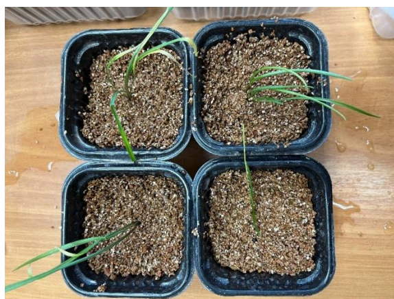
Рис. 5 Посадка растений Lilium pumilum Delile в питательные субстраты для последующего доращивания

Через 3 месяца растения (рис. 4) высаживались в питательные субстраты для последующего доращивания (рис. 5).